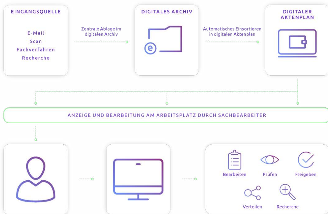
Das Prinzip der digitalen Akten